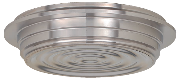
Separador con conexión estéril, modelo 990.24

VARINLINE® es una marca registrada de la empresa GEA Tüchenhagen GmbH.