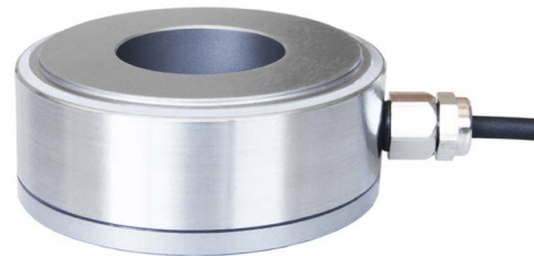
Ringkraftaufnehmer, Typ F6215