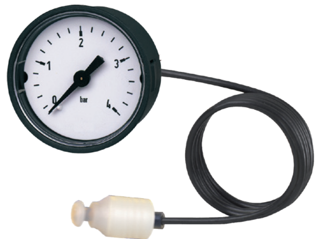
Manometro a molla tubolare modello 101.00.040

In caso di differenza tra la temperatura di riferimento (+20 °C) e quella del sistema di misura: max. \pm 0,4 \% /10 K della differenza