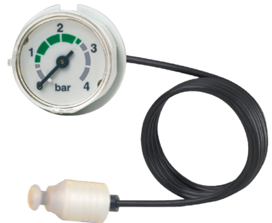
Manometro a molla tubolare modello 101.12.027