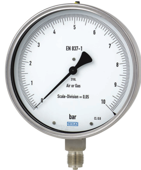
Feinmessmanometer, CrNi-Stahl, Typ 332.50