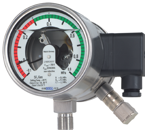
Manodensostato con trasmettitore integrato, modello GDM-100-TI