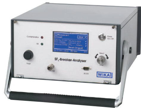
Analysegerät, Typ GA10