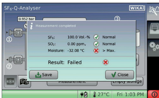
Visualizzazione valore misurato

Il GA11 consente di importare in modo rapido e semplice un elenco di punti di misura, modificati su PC. Data la complessità delle misurazioni, il possesso di conoscenze specifiche costituisce un pre-requisito, vedere IEC 62271-4:2013, ASTM D2029-97:2017 e CIGRÈ - Guida sulla misura SF 6 (723).