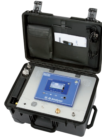
Analizzatore modello GA11