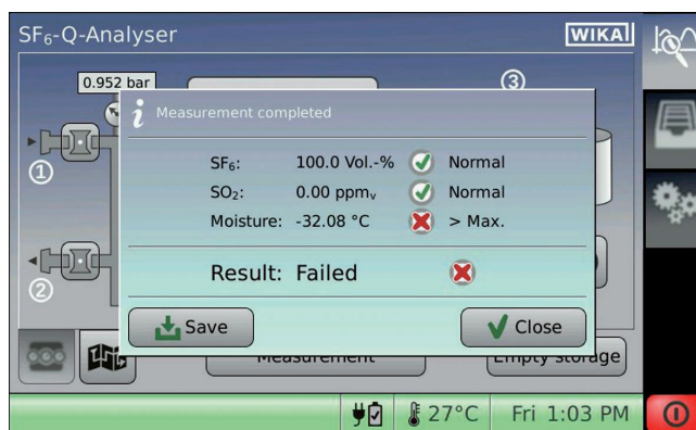
Visualizzazione valore misurato

Il GA11 consente di importare in modo rapido e semplice un elenco di punti di misura, modificati su PC. Data la complessità delle misurazioni, il possesso di conoscenze specifiche costituisce un pre-requisito, vedere IEC 62271-4:2013, ASTM D2029-97:2017 e CIGRÈ - Guida sulla misura SF 6 (723).