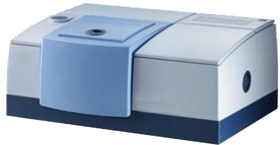
Sistema de medición para análisis de laboratorio, modelo GFTIR-10