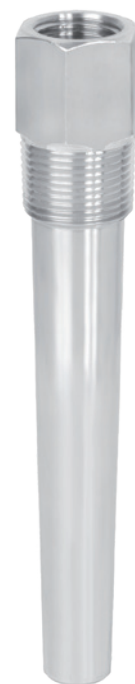
Pozzetto termometrico filettato, esecuzione TW15-H