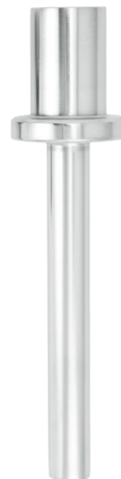
Vaina para bridas solapadas, modelo TW30